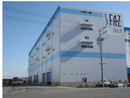
「興津国際流通センター2号棟」→

清水港は、平成8年に輸入促進地域（FAZ）に指定され、その際「興津国際流通センター1号棟」ができました。隣接して2号棟が完成したことにより、物流の効率化が進み、輸入促進に弾みがつきそうです。