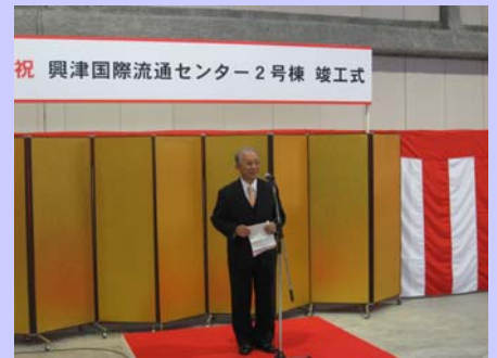
しゅん工式の様子