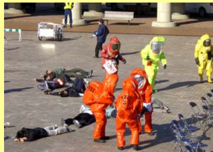
消防による救助活動