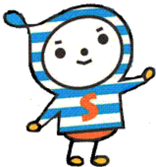
しみずくんちゃん