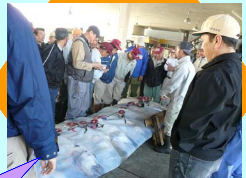
いよいよセリがスタート

参加する仲買人などがマグロの状態をチェックしています。マグロの上に尾の部分を取り切ったものを並べてあり、それを見て、脂ののり、しまり具合などをチェックしているんです。