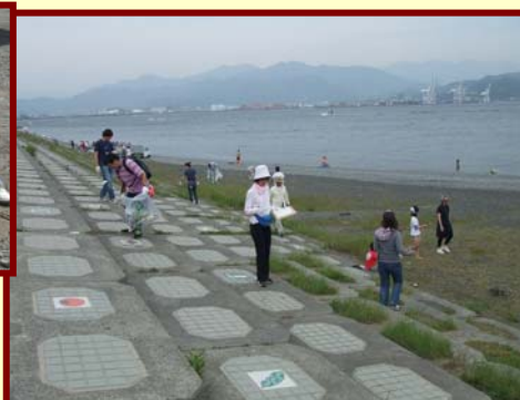
三保海岸で行ったクリーンアップの様子 ↑ →