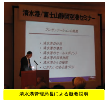
清水港管理局長による概要説明