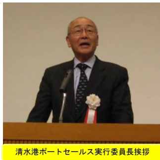
清水港ポートセールス実行委員長挨拶