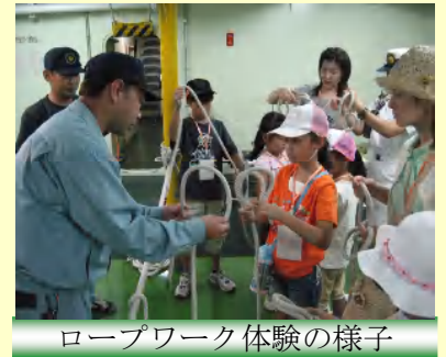
ロープワーク体験の様子

後日、清水港客船誘致委員会が親子見学会参加者に行ったアンケート調査では、「参加して大変よかった」と喜びの声がたくさん届きました。港に親しみ、港に関心を持つ良い機会になりました。