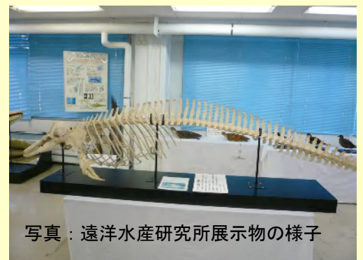
写真：遠洋水産研究所展示物の様子