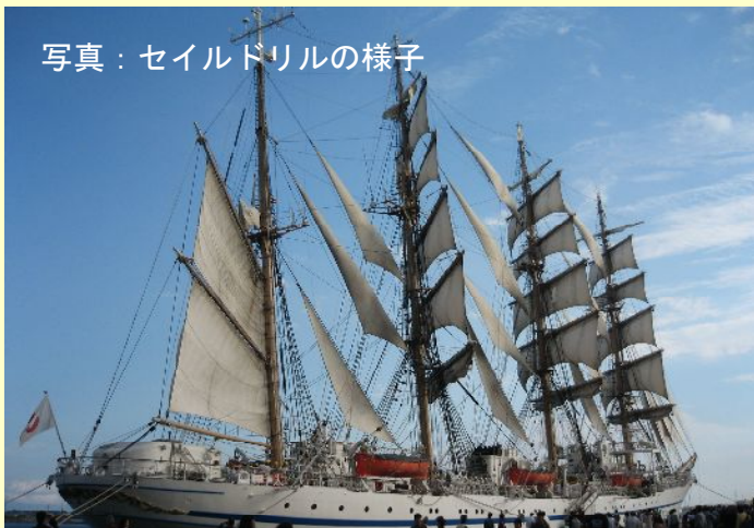
写真：セイルドリルの様子

※駐車場について： 日曜日のみ静岡市鉄道岸壁を開放します。その他の曜日は有料駐車場をご利用ください。