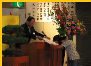
清水港管理局長表彰

清水港を海上から見渡し、また、普段見る機会の少ない大型クレーンを間近に見てもらい、清水港のスケールの大きさを実感してもらいました。清水港の役割や将来の姿などを伝えることができたのではないのでしょうか。