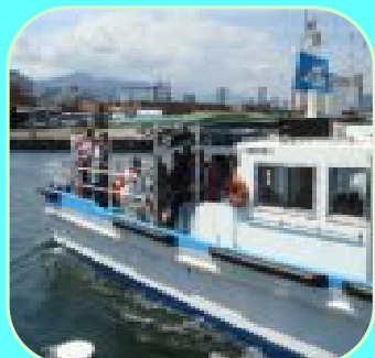
みなと見学会へ出航

5月31日、6月1日に清水マリンターミナルで開催された「第1回インポートバザール&第9回フラワーショー」には、世界各国のお酒、衣料品、雑貨等を扱う12の輸入業者が出店。また地元産のバラ約50種類やコンテスト作品が展示され、およそ15,000人の県民で賑わいました。展示作品を販売するセリ売りの会場は、威勢の良い掛け声と参加者の笑い声であふれていました。