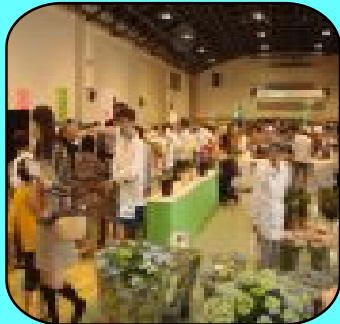
フラワーショー会場