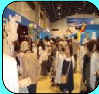
インポートバザールの様子

5月31日、6月1日に清水マリンターミナルで開催された「第1回インポートバザール&第9回フラワーショー」には、世界各国のお酒、衣料品、雑貨等を扱う12の輸入業者が出店。また地元産のバラ約50種類やコンテスト作品が展示され、およそ15,000人の県民で賑わいました。展示作品を販売するセリ売りの会場は、威勢の良い掛け声と参加者の笑い声であふれていました。