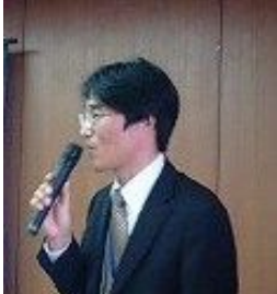
11月9日 富士貿易協議会

ポートセールス担当は清水港の広報宣伝部隊です。一人でも多くの方々に清水港をご利用いただけるよう、いろいろな所で清水港の魅力やメリットをアピールしています。