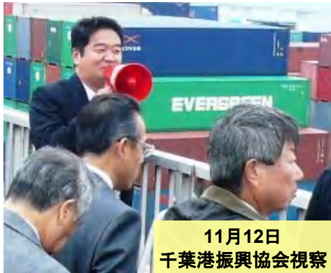
11月12日 千葉港振興協会視察