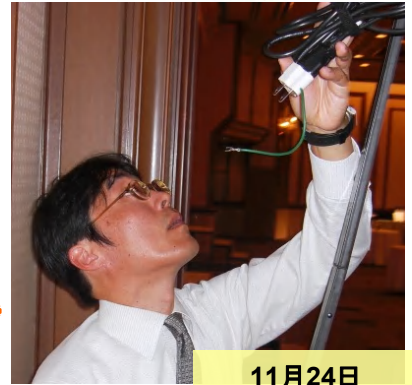
11月24日 首都圏セミナー

ポートセールス担当は清水港の広報宣伝部隊です。一人でも多くの方々に清水港をご利用いただけるよう、いろいろな所で清水港の魅力やメリットをアピールしています。