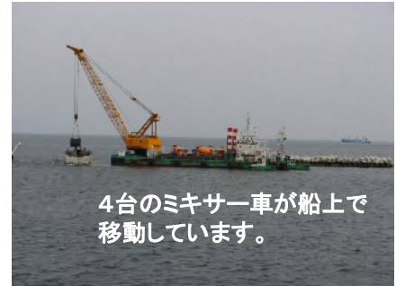
4台のミキサー車が船上で移動しています。

1つの重さが約40t(普通自動車約26台分)のコンクリートブロックも作業船に載せて運び、海上で、組み合わせます。 一番上のコンクリートは、コンクリートミキサー車を、船に載せて海上で打設しました。