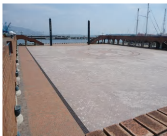
週末にはフリーマーケットなどのイベントが行われるイベント広場