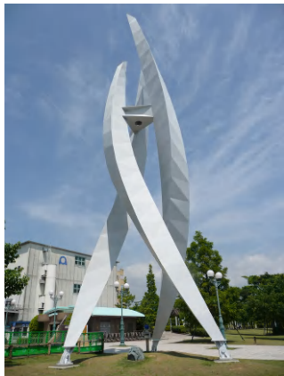
清水港開港100周年モニュメント。3本の曲線柱は「発展」「共生」「調和」を表しています。