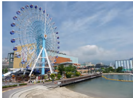
昨年、エスパルスドリームプラザに完成した観覧車やボードウォークのイルミネーションにより、昼と夜で異なった顔が楽しめます。