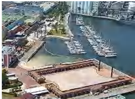
清水マリパーク(上空から)

清水マリパークは、指定管理者制度により、清水マリターミナル(客船待合施設、多目的ホール)やマリパーク(駐車場)などと併せて民間企業に管理、運営をお願いしています。民間の営業ノウハウや柔軟なアイデアにより、パーク内で多彩なイベントを行ったり、イルミネーションで施設の飾り付けを行ったりするなど、日の出地区のより一層の賑わいを目指しています。