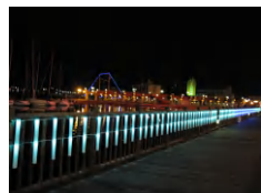
サマーイルミネーションは18時に点灯します。8月30日(日)までお楽しみいただけます。