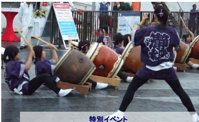
特別イベント ～静岡市立商業高校生による「和太鼓」の演奏～