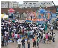
高校生クイズ 富士山大会

これから清水みなと祭りや高校生クイズ富士山大会の開催などイベントが目白押しだね!