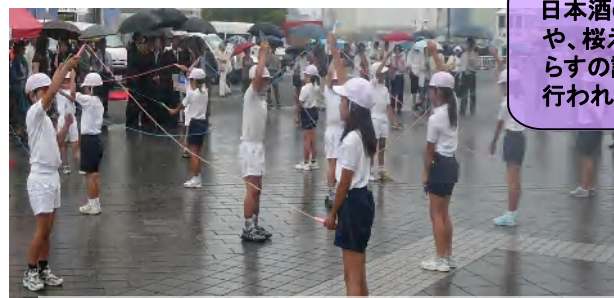
歓迎式典 ～静岡市立清水浜田小学生による「リズムなわとび」の披露