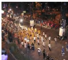
清水みなと祭り かつぼれ総踊り