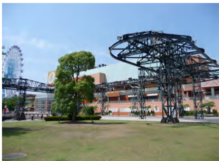
登録有形文化財でもあるテルファークレーン。木材等の積み込みに使用され、清水港の発展を支えました。