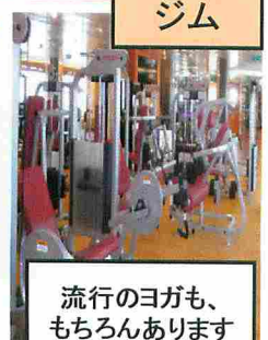
流行のヨガも、 もちろんあります