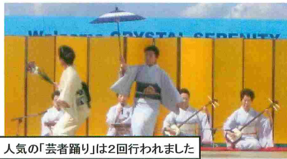
人気の「芸者踊り」は2回行われました

岸壁には特設ステージも設置されて、「雅楽の演奏」や「芸者踊り」が行われたよ！日本の伝統芸能は外国人に大人気なんだ♪