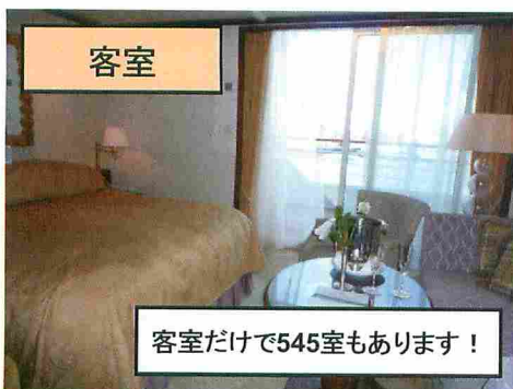
客室だけで545室もあります!