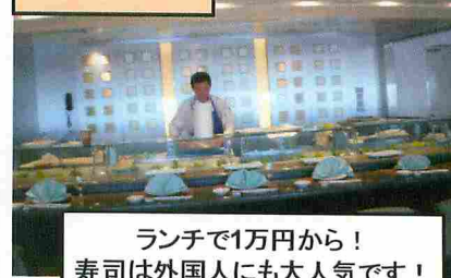
ランチで1万円から! 寿司は外国人にも大人気です!