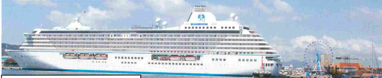
日の出岸壁に接岸する「クリスタル・セレンティ」

午前11時から清水港客船誘致委員会による歓迎セレモニーも開催され、清水港開港110周年記念事業実行委員会顧問も務める静岡市長の挨拶につづき、地元小学生による花束のプレゼントなども行われ、この日一日、日の出埠頭は歓迎ムード一色に彩られました。