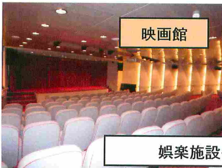
娯楽施設も充実です!