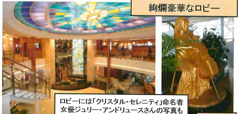
ロビーには「クリスタル・セレンティ」命名者 女優ジュリー・アンドリュースさんの写真も