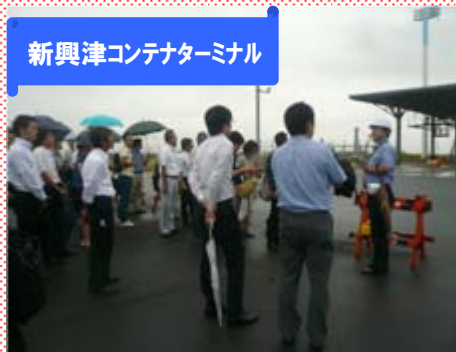
新興津コンテナターミナル