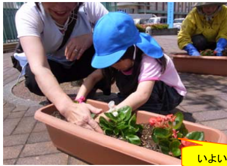
いよいよ植栽です♪