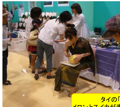
タイの「カービング」メロンとスイカが素敵な作品になりました