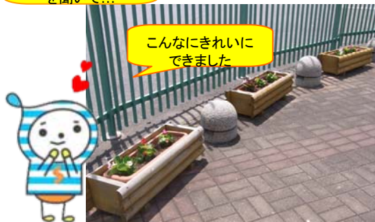
こんなにきれいにできました