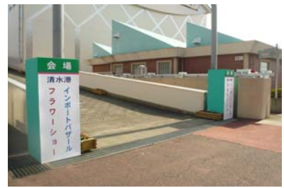
植えられた花は、インポートバザール&フラワーショーの会場入口に飾られました。