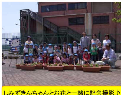
しみずきんちゃんとお花と一緒に記念撮影♪