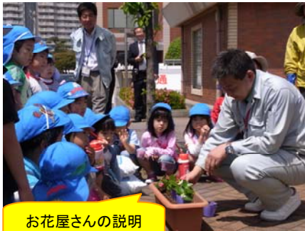
お花屋さんの説明を聞いて...

5月17日（月）、清水港インポートバザール&フラワーショーのイベントとして、清水保育園の園児による花の植栽がほっとするがで行われました。会場に着いた園児たちは元気いっぱいあいさつ。説明が終わると、慣れない手つきながらも一生懸命に植栽をしていました。