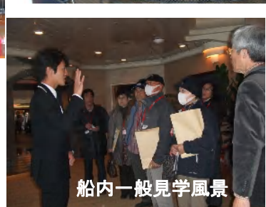
船内一般見学風景