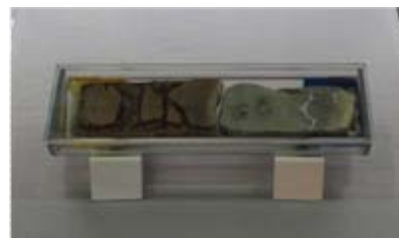
海底から採取された地層サンプル