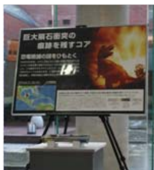
研究を紹介するパネル