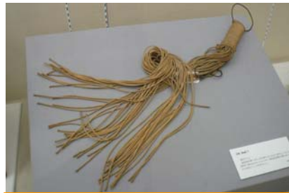
あみだくじ・・・荷役作業で、公平に仕事を割り当てるために、使われていた