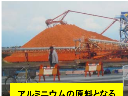
アルミニウムの原料となるボーキサイトの山。