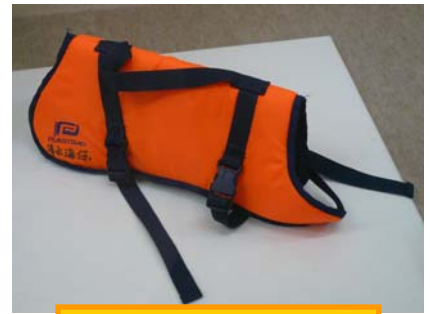
泳げない犬のための、犬用救命胴衣！！