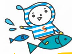
港での仕事や港の歴史、役割がよくわかったよ。