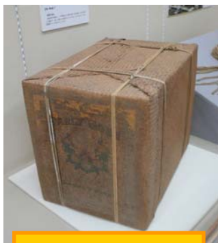
お茶の輸出用の箱