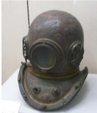
港を築く工事の時使われた潜水ヘルメット

清水港にある、「これ、なあと？」と思うような“港の風景”や“港で使われるもの”、また、今では見られなくなってしまったけれども「これなんだろう？」と考えさせられる道具の写真や資料が展示されていました。