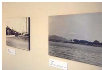
昔の清水港の写真も展示されていたよ。