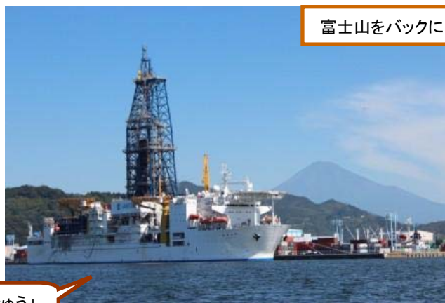
富士山をバックに

清水港で必要な資機材を積み込み、紀伊半島沖に向けて10月4日（木）に出港しました。