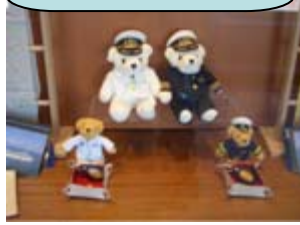
「飛鳥Ⅱ」オリジナルキャラクター