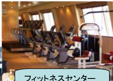
フィットネスセンター