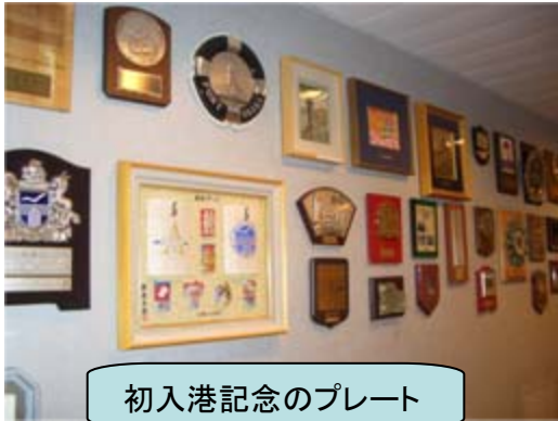
初入港記念のプレート