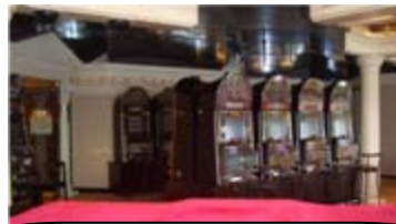
カジノ(※換金できません。)