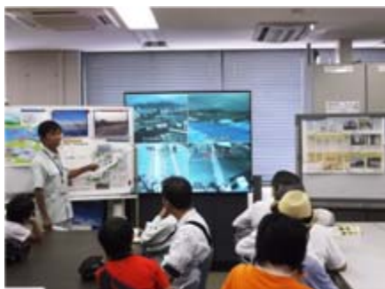
津波防災ステーション

8月21日(水)、「県民の日」イベントの一環として、「清水港見学会」を開催しました。「津波防災ステーション」や「陸こう」の見学のほか、港内巡視艇「ひので」に乗船し、清水港内の様子を見学しました。