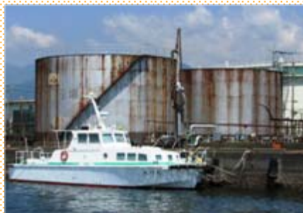
塗替え予定の江尻廃油タンク。