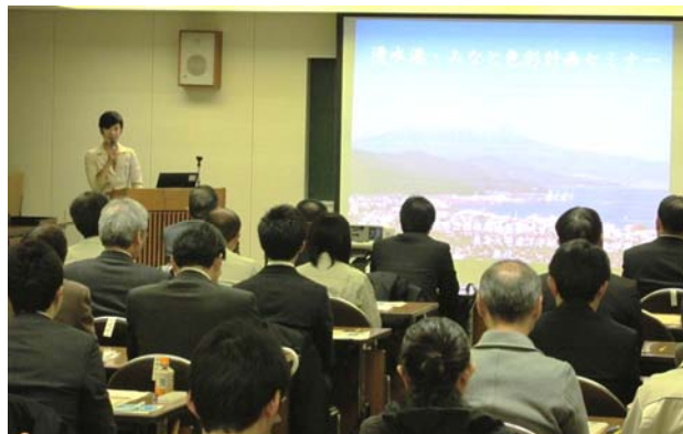
東恵子アドバイザー会議座長より色彩計画の説明

協力企業への感謝状やステッカーの授与、各企業による事例紹介、そして初の試みとして船上見学が行われ、海上から清水港を見学しました。