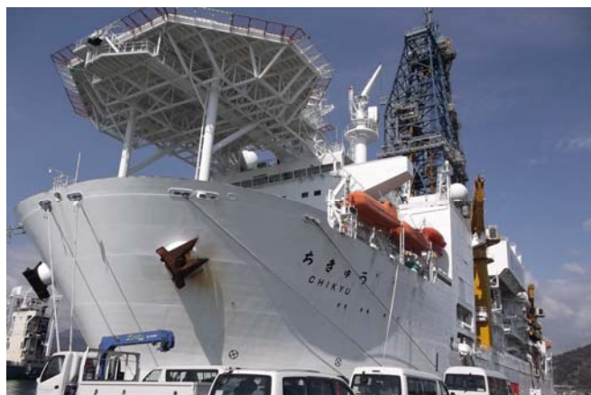
停泊中の「ちきゅう」

54名の中高校生が参加し、船内の設備や機能、海底掘削の仕組みなどについて説明を受けました。