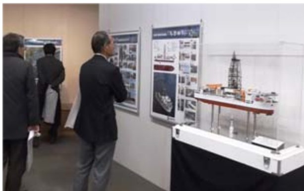
展示されている模型やパネル

現在、フェルケール博物館において、企画展「ちきゅうと海底資源—日本の海洋開発—」を開催しています。