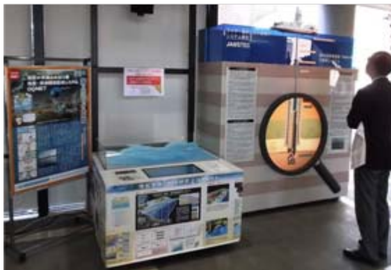
掘削システムなどの模型