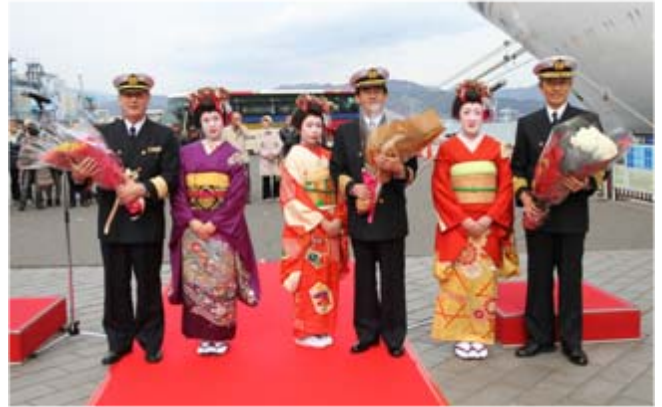
記念に花束の贈呈