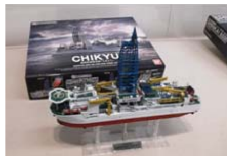
「ちきゅう」のプラモデルもあるよ。

フェルケール博物館 電話 054-352-8060 開館時間 9:30~16:30(休館日 月曜)