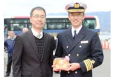
静岡みかんの贈呈