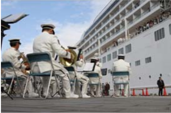
消防音楽隊による歓迎の演奏

1月8日（水）、国内最大の豪華客船「飛鳥Ⅱ」が入港しました。横浜発着のクルーズで、今年度2回目の入港です。