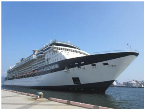
「セレブリティ・ミレニアム」入港