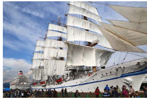
セイルドリルと「飛鳥II」