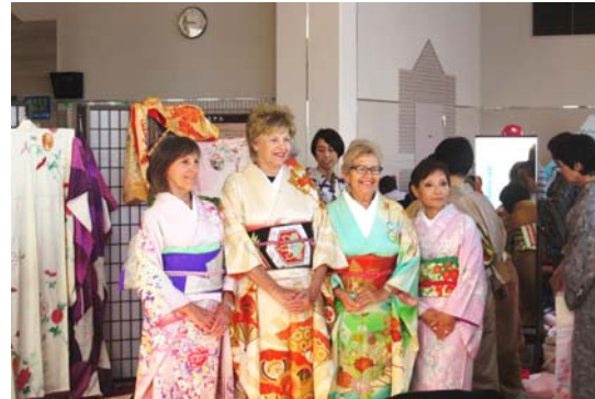
大人気だった着付け体験