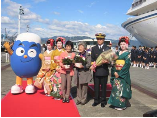
記念品のプレゼント