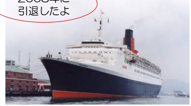
クィーンエリザベス2