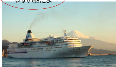
ばしゅいっく びいなす