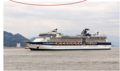
セレブリティ・ミレニアム