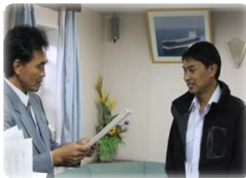
“Welcome!” 歓迎の言葉を船長へ