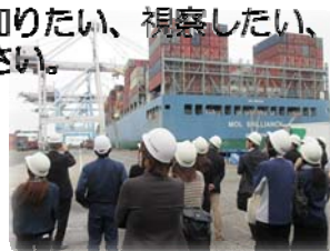
埠頭で荷役を視察