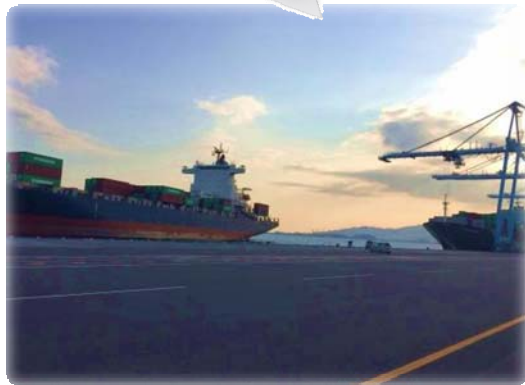
11月7日 インドネシア航路の初入港船 ウル・ブームが新興埠頭に着岸