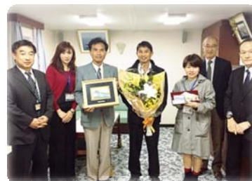
清水港管理局長らて 船長を訪問し、記念品を授与