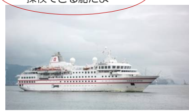
ハンセアティック