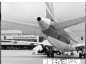
離陸を待つ航空機