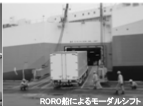
RORO船によるモーダルシフト