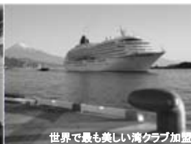
世界で最も美しい湾クラブ加盟