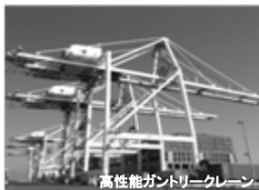
高性能ガントリークレーン