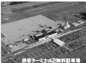
旅客ターミナルと無料駐車場