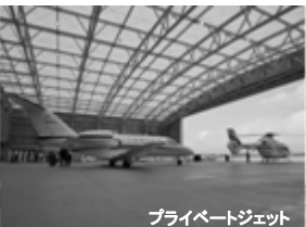
プライベートジェット